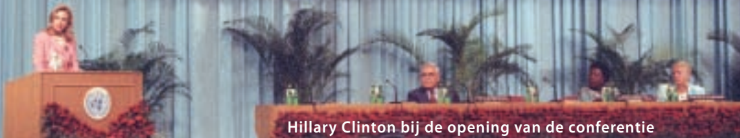
Hillary Clinton bij de opening van de conferentie

192 lidstaten van de VN op een gegeven moment lid is van de CSW. De CSW speelde een belangrijke rol bij de organisatie van de vier VN Wereldconferenties en doet dat nog steeds.